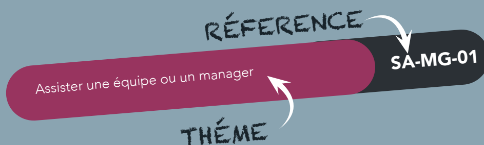
SCHÉMA DE LECTURE